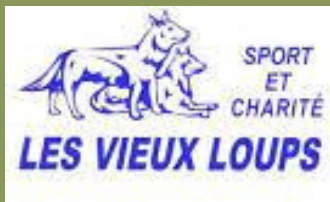
Jean-Michel Fontaine 100KM